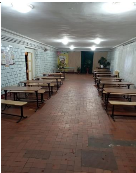
Фото обеденного зала