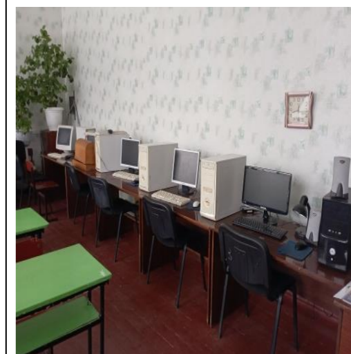
Фото компьютерного класса