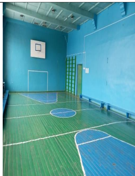
Фото спортивного зала